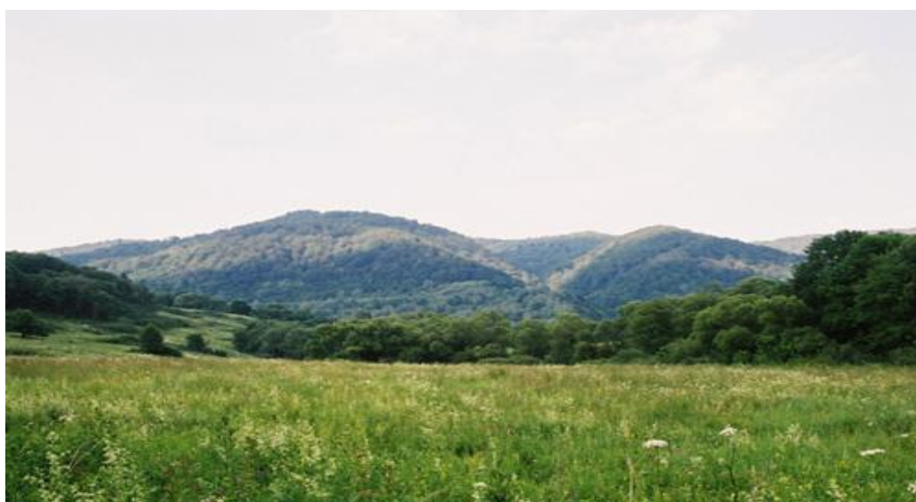
Widok na Pasma Otrytu

Położenie miejscowości na południowej stronie pasma Otrytu powoduje wydłużenie okresu wegetacyjnego w tamtym rejonie. W efekcie w Chmielu 13 gospodarstw domowych (dość dużo jak na bieszczadzkie, górskie warunki) zajmuje się działalnością rolniczą. Ponadto najprężniej rozwijającymi się dziedzinami gospodarki są leśnictwo i usługi agroturystyczne. Działalność gospodarczą w zakresie usług leśnych zarejestrowaną ma 12 osób. We wsi funkcjonują 2 gospodarstwa oferujące noclegi dla turystów oraz 3 gospodarstwa agroturystyczne. Jedno z nich ma status Ośrodka Górskiej Turystyki Jeździeckiej. W granicach Chmiela jest także schronisko „Chata Socjologa”, znajdujące się na szczycie pasma Otrytu. Dodatkowo dwie osoby prowadzą działalność w innych branżach. We wsi działa także jeden sklep spożywczo - przemysłowy.