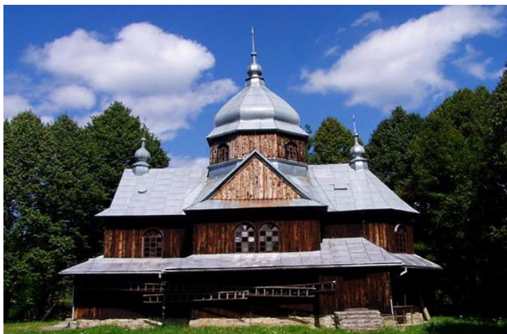
Cerkiew pw. św. Mikołaja

W jego obrębie planowana jest budowa świetlicy wiejskiej z garażem, która będzie jedynym obiektem ogólnodostępnym dla mieszkańców, a przy okazji siedzibą Ochotniczej Straży Pożarnej.